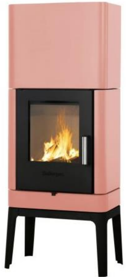
BULLERJAN B 3 KERAMIK